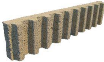
Figura 3: Immagine di un elemento per barriere acustiche ISOTEX

E' qui sopra riportata un'immagine di un elemento per barriere acustiche.