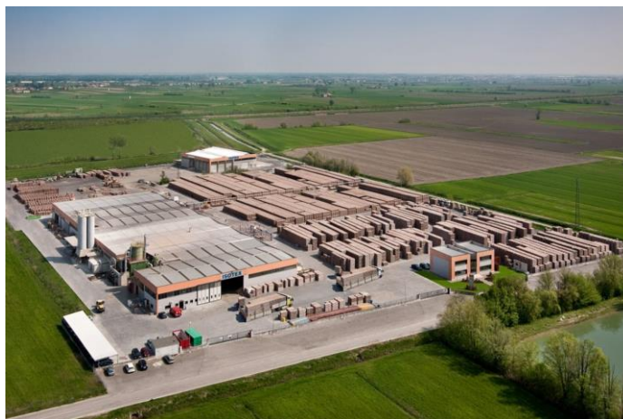
Figura 1: Il sito produttivo di ISOTEX

L'azienda ha implementato un sistema di controllo qualità secondo la norma EN ISO 9001:2008 ed è certificato di conformità ANAB/ICEA per i materiali per la Bioedilizia.