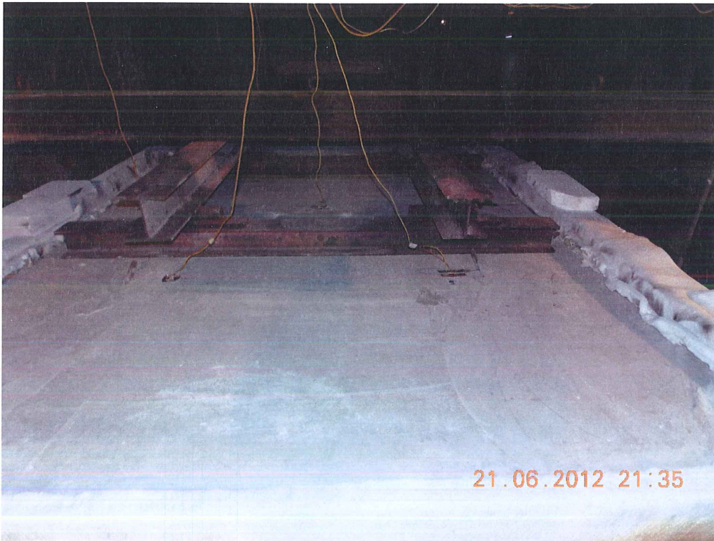
Foto 3. Lato non esposto al fuoco del solaio dopo la prova