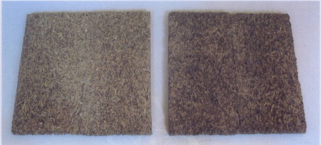
Fotografia delle provette.

Dal campione in esame sono state ricavate, mediante incollaggio e successiva rettifica, n. 2 provette aventi dimensioni 499 \times 503 mm.